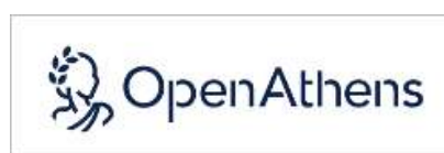
↑ OpenAthens バナー

ブラウザに以下の URL を直接入力または QR コード読み取りでの利用も可能です。